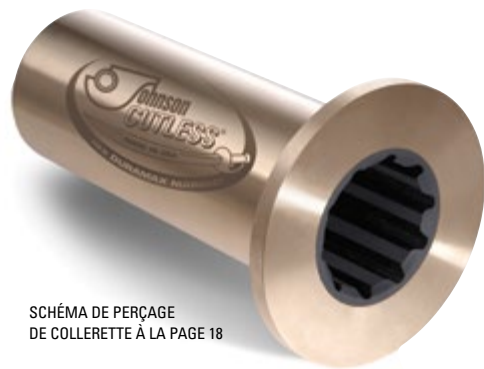
SCHEMA DE PERÇAGE DE COLLERETTE À LA PAGE 18

Les paliers à collerette Johnson Cutless® sont en laiton naval coulé par centrifugation avec une collerette intégrée pour les boulonner sur un tube d'étambot ou un logement de chaise qui permet de maintenir le palier et d'éviter sa rotation dans son logement. Le caoutchouc nitrile de formulation spéciale, résistant à l'huile et aux produits chimiques est parfaitement collé sur la coquille. Les coquilles ont une paroi épaisse assurant la résistance structurelle et peuvent être tournées avec des épaulements si nécessaire. Les collerettes sont fournies NON PERCÉES, sauf spécification contraire. Reportez-vous à la page 18 pour les schémas de perçage. Pour les modèles divisés et épaulés, reportez-vous aux pages 14-17.